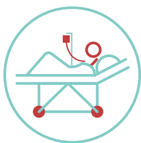
Le séjour chirurgical et la prothèse