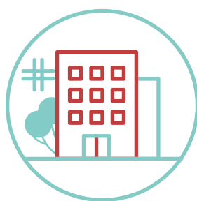
Les soins hospitaliers et en ville pendant un mois