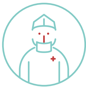
L'ensemble des soins liés aux complications en lien avec la prothèse