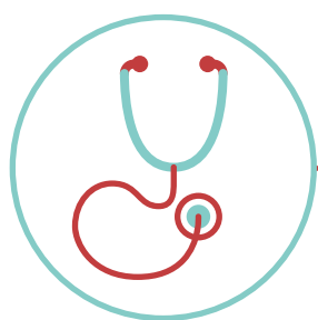
Les soins préhospitaliers

Orthochoice se caractérise par la mise en place d'un paiement forfaitaire couvrant l'intégralité du parcours patient :